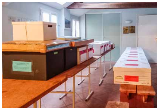
Les 26 boîtes d'archives prêtes à partir

La revue nationale « + PHOTOGRAPHIE » éditée par le ministère de la Culture comportera en 2026 deux pages signalant la donation.