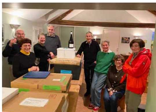
Verre d'amitié à la fin d'un travail bien fait

Nous vous souhaitons une très belle fin d'année et espérons vous retrouver en personne en 2026.