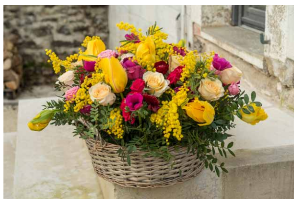
Hommage floral de l'association